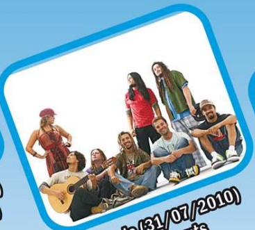
Sábado (31/07/2010) Chimarruts