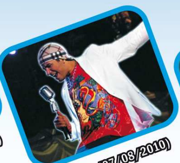
Sábado (07/08/2010) Latino