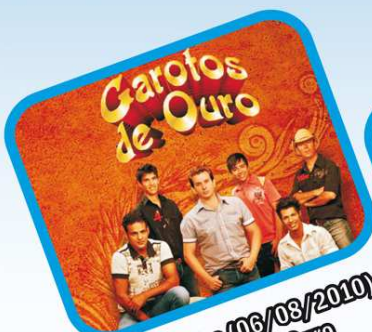
Sexta-feira (06/08/2010) Garotos de Ouro