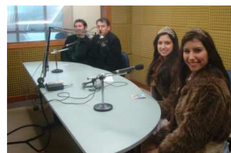
Secretário, prefeito, rainha e princesa na Rádio Muller.