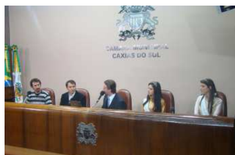
Na Câmara de Vereadores de Caxias, atenção especial.