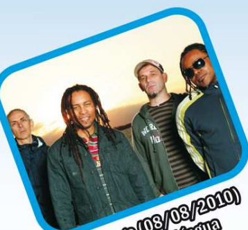
Domingo (08/08/2010) Papas da Língua

Informações : Secretaria de Turismo - 3687-2777