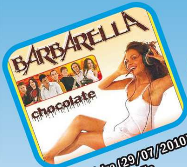
Quinta-feira (29/07/2010) Barbarella