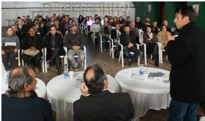
Prefeito, falando para o povo que foi conferir a assinatura do novo contrato com a CORSAN