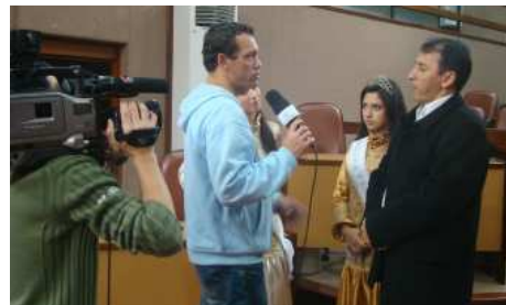
Rainha e prefeito na Rádio Câmara, em Caxias.