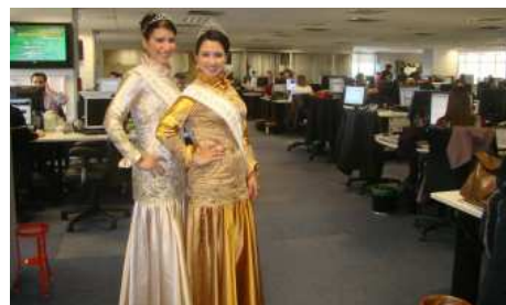
Rainha e princesa na redação de Zero Hora.