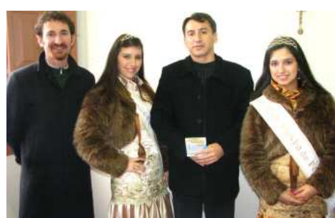
Na redação do Jornal O Garibaldense, de Garibaldi.