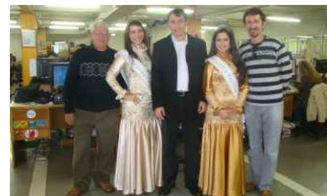
Comitiva na redação do Jornal O Pioneiro, em Caxias do Sul