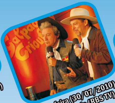
Sexta-feira (30/07/2010) Galpão Crioulo (RBSTV)