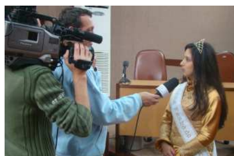
Rainha sendo entrevistada pela TV Câmara